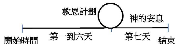
圖二:錯誤的示意圖

我以前沒有注意到創世記 2:3 是指創世的工作已完成了，以為耶穌在約翰福音 5:17 所說的「我父做事直到如今」是指仍在做創世的工作，因此認為我們仍在第六天中。這時救恩的計劃只好用圓來表示，如所示的錯誤示意圖二中所說，圓的大小是未知，因為在救恩的計劃中不知耶穌何時會再來，大小就代表救恩計劃的長短。